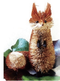
可愛い動物の飾りもの 各種取り揃えております！