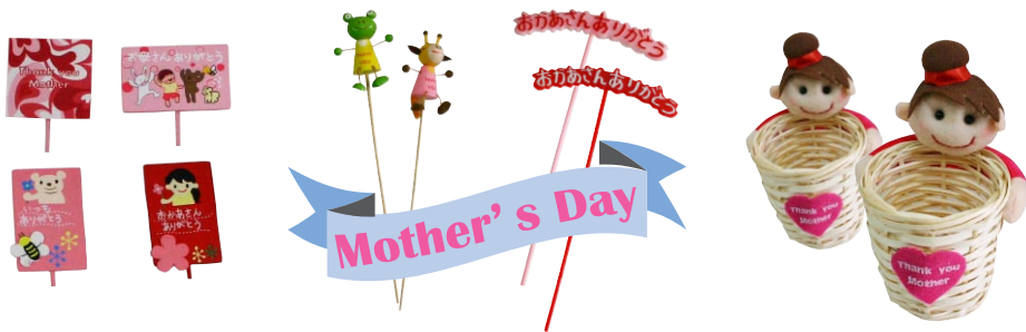
母の日のアイテム各種取り揃えています！

さて、マツシバでは一足お先に母の日の商品を幅広く取り揃えております。是非、ご準備はお早めに。今月もマツシバをどうぞよろしく願いいたします。