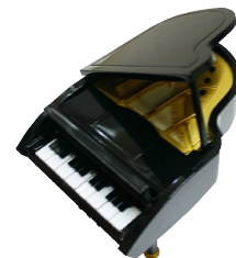
オルゴール付きピアノの小物