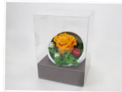
プリザーブドアレンジ