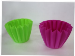
カラフルなコンポート