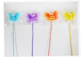
めつばちのピロク