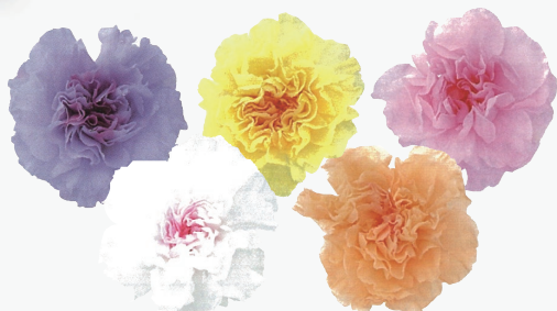
ミニカーネーション ミルフィーユ新登場！