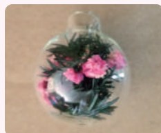
③ なかに葉物やカスミ草等 (何でもOKです)を入れる