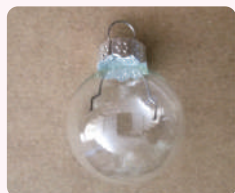
① クリアのガラスボール (まつむら通信96号掲載) を用意する