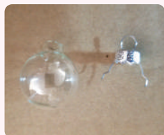
② ガラスボールの金属の部 分を外す