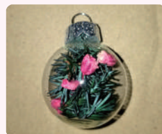
④ 金具を元に戻して出来上 がり!